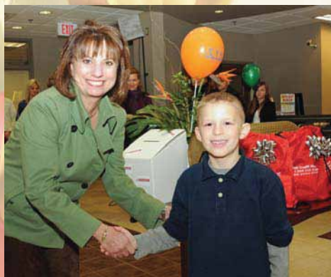
Zdobywca jednej z nagród w konkursie CYS w lutym 2010 roku