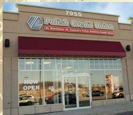
Oddział Millennium w Brampton