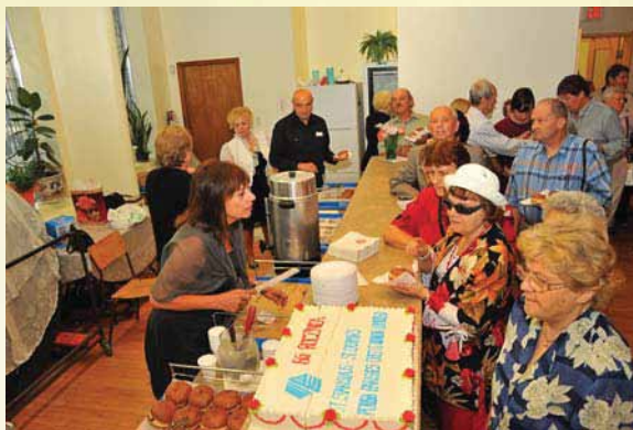
Urodzinowy poczęstunek z okazji 65-lecia założenia Polskiej Credit Union po mszy św. w Parafii św. Stanisława Kostki w Toronto