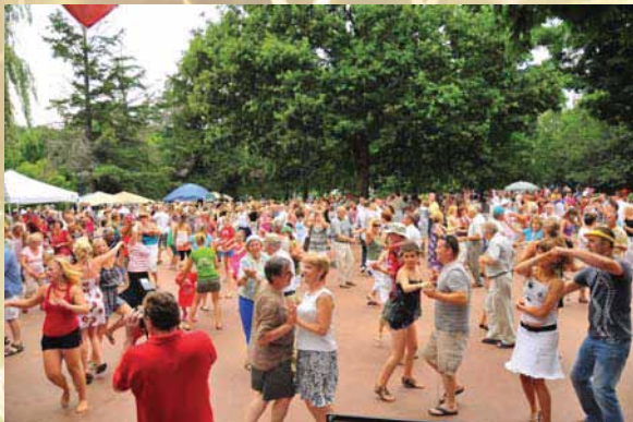
Zabawa podczas Wielkiego Pikniku Rodzinnego 2010 w Parku Paderewskiego